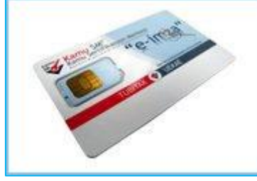
Şekil 1-Nitelikli Elektronik Sertifika

Kurye tarafından size teslim edilen kartta yer alan Nitelikli Elektronik Sertifikanın yüklü olduğu çipli parçayı aşağıdaki resimdeki gibi hasar vermeden işaretli yerlerinden kırılarak çıkarılır. Eğer kenarlarında çapak kaldıysa uygun bir alet ile zarar vermeden temizlenir.